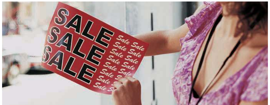
Xerox® NeverTear Window Signs

Unser speziell für Polyester-Bedruckstoffe geeigneter EA-Toner mit niedriger Schmelztemperatur wird bei der Ausgabe chemisch fest auf dem Polyester fixiert und liefert zuverlässig hervorragende Bildqualität auf Spezialdruckmaterial wie Polyester und anderen Stoffen. In Kombination mit Premium NeverTear ist unser EA-Toner widerstandsfähig gegen Wasser, Öl, Fett und Verschleiß.