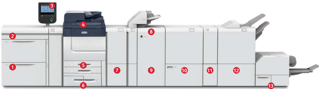
Xerox® PrimeLink® C9065/C9070-Drucker

1 Großraum-Papierbehälter für Überformate mit zwei Behältern: Für weitere 4.000 Blatt in Formaten von 182 x 250 mm (B5) (bis zu 350 g/m 2 ) bis 330 x 660 mm (bis zu 220 g/m 2 ).